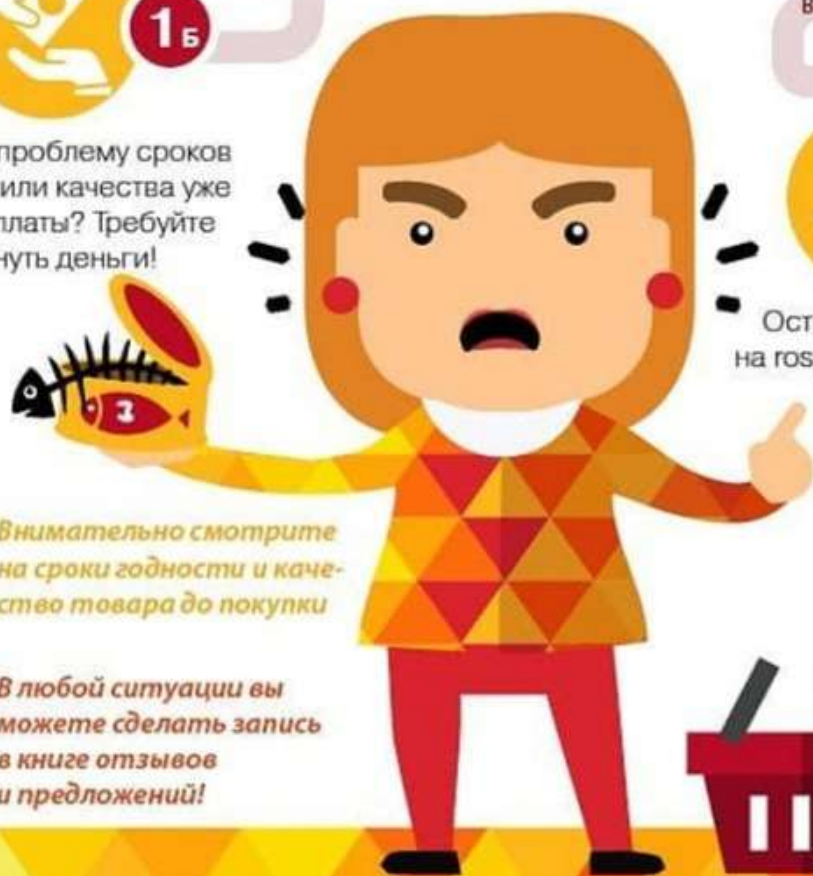
Фото- и видеоматериалы помогут подтвердить вашу правоту.