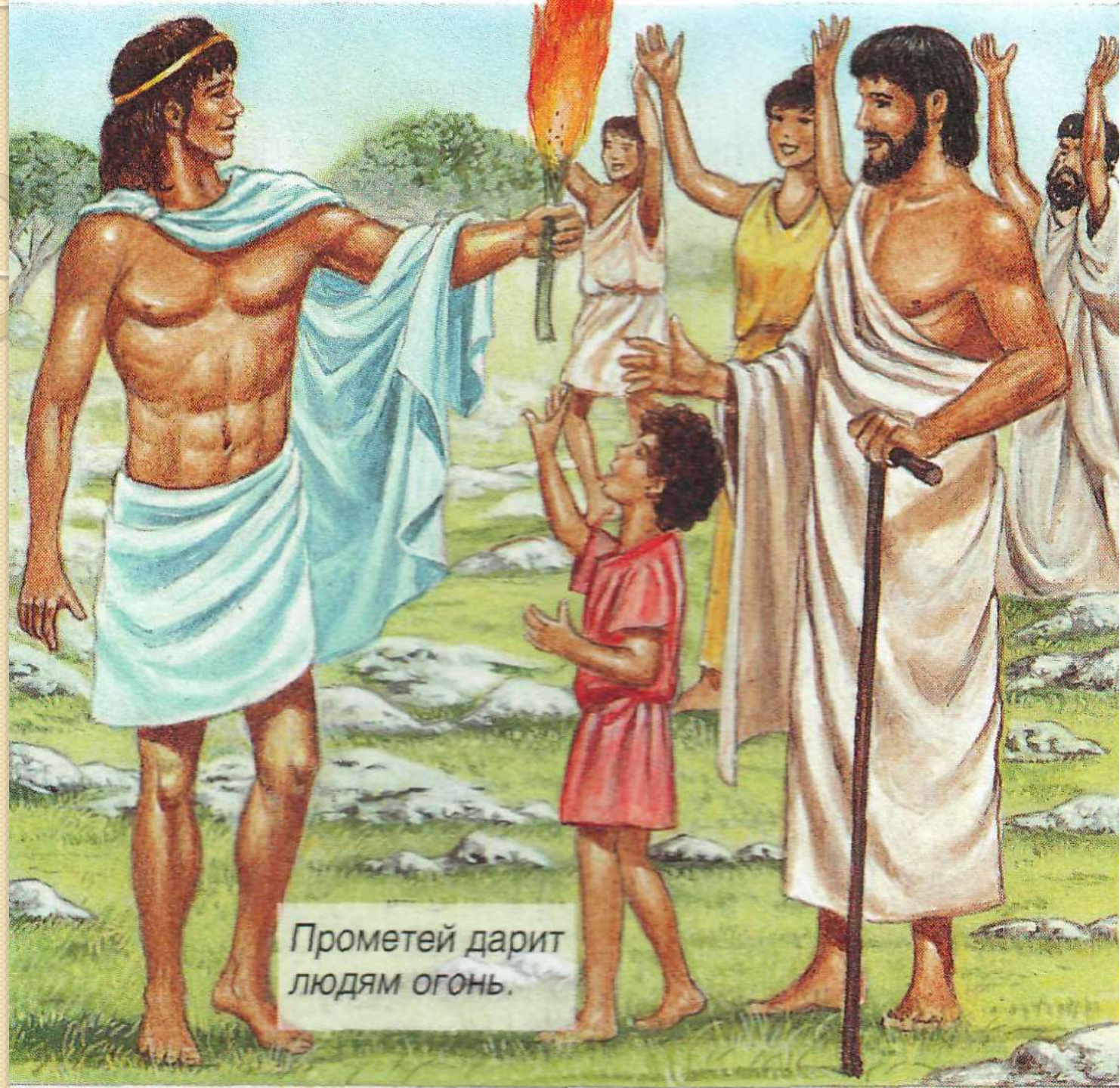
Прометей дарит людям огонь.